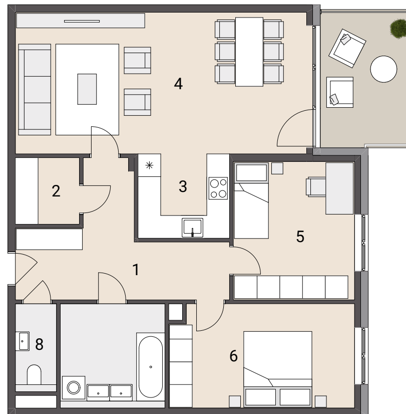
Top 4.12 ►

Wolfgang Tröscher +43 1 797 00 - 125 wolfgang.troesch@arwag.at www.arwag.at